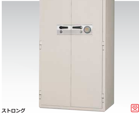
ストロング KCS34-2DKS 879,000円(税込み949,320円)