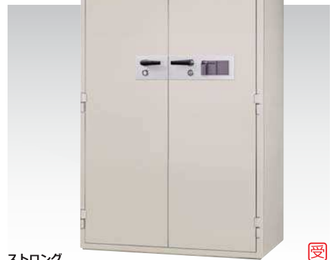
ストロング KCS35-2FPEKS 1,040,000円(税込み1,123,200円)