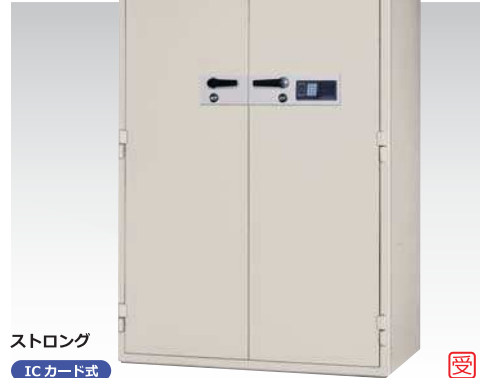
ストロング ICカード式 KCS35-2RFEKS 1,003,000円(税込み1,083,240円)