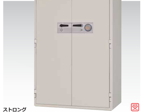
ストロング KCS35-2DKS 946,000円(税込み1,021,680円)