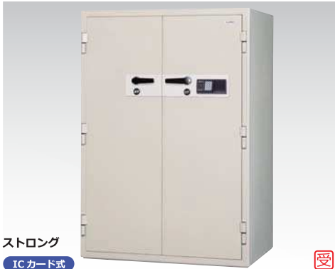
ストロング ICカード式 KCS33-2RFEKS 849,000円(税込み916,920円)