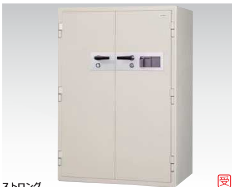
ストロング KCS33-2FPEKS 889,000円(税込み960,120円)