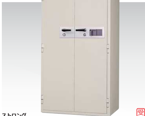
ストロング KCS34-2FPEKS 975,000円(税込み1,053,000円)