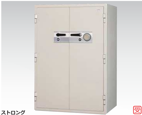
ストロング KCS33-2DKS 793,000円(税込み856,440円)