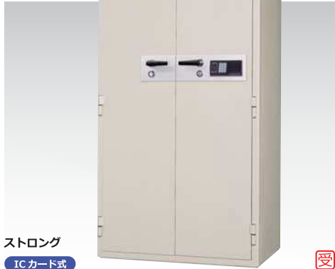
ストロング ICカード式 KCS34-2RFEKS 936,000円(税込み1,010,880円)