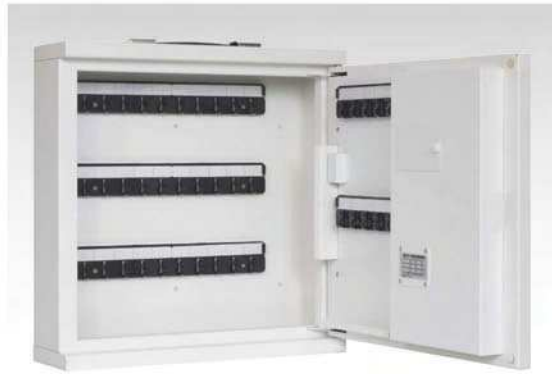
※据え置きでご利用の場合は、オプションのベースをご利用ください。