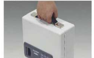
持ち運び用ハンドル付