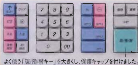
よく使う「現/預/替キー」を大きくし、保護キャップを付けました。

使用頻度の高いキーが大きく、誤操作を抑えます。金額入力、分類キー、売上キーをブロックごとに配列。忙しい時間帯でもレジ操作が迅速にできます。