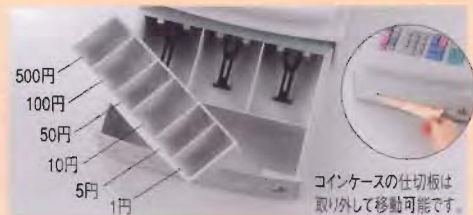
コインケースの仕切板は取り外して移動可能です。

ドロア前面には、コインケースを外さなくても1万円札や伝票を挿入できる便利なスリットを採用。コンパクトなドロアながら、流通貨幣をすべて分類収納できます。