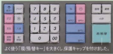
よく使う「現/預/替キー」を大きくし、保護キャップを付けました。

使用頻度の高いキーが大きく、誤操作を抑えます。金額入力、分類キー、売上キーをブロックごとに配列。忙しい時間帯でもレジ操作が迅速にできます。