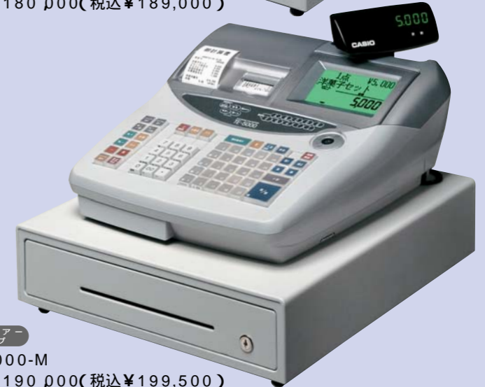
中型ドローアタイプ

TE-5000-S メーカー希望 小売価格 ¥180,000(税込 ¥189,000)