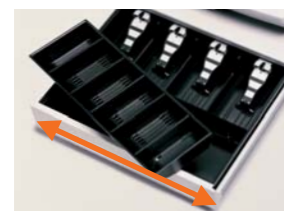
全金種に対応できる余裕の「中型ドローア」タイプ(TE-5000-M)