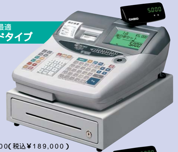
小型ドローアタイプ

TE-5000-S メーカー希望 小売価格 ¥180,000(税込 ¥189,000)