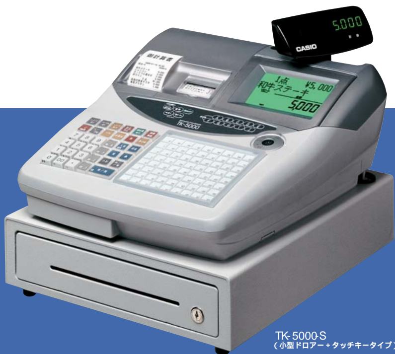
TK-5000-S (小型ドロアー+タッチキータイプ)