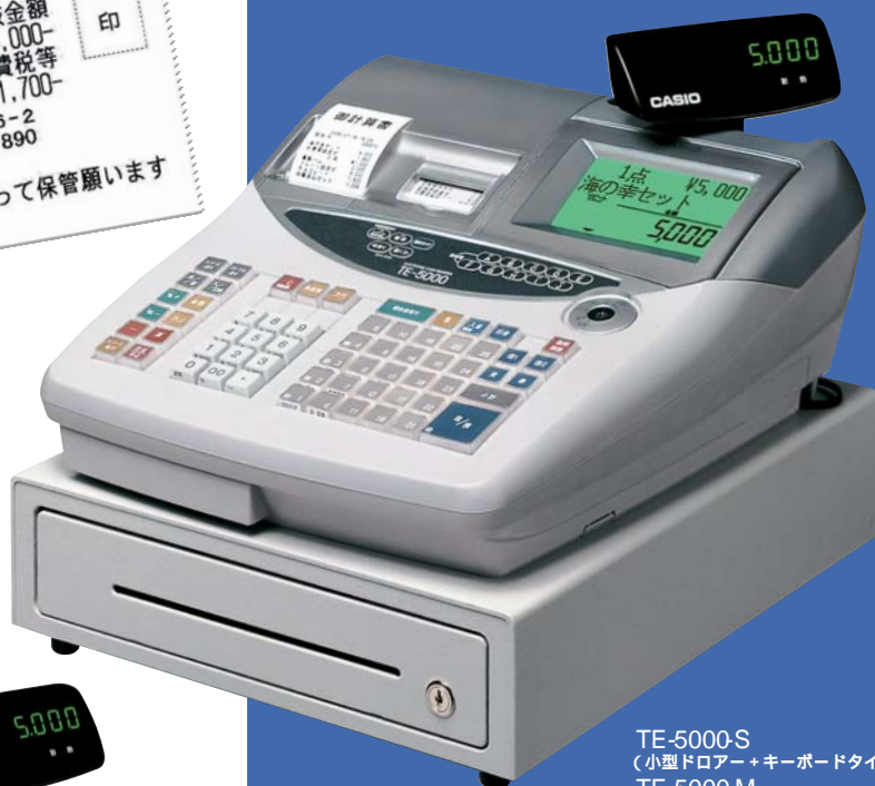
TE-5000-S (小型ドロアー+キーボードタイプ) TE-5000-M (中型ドロアー+キーボードタイプ) 写真はTE-5000-Sです。