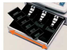
置き場所を選ばない省スペースの「小型ドローア」タイプ(TE/TK-5000-S)

ドローアにはスチール製NEWタイプドローアを搭載。紙幣4種、硬貨6種が収納できます。さらに、コインレを外さなくても1万円札や商品券、伝票などを挿入できるスリットを採用。また、硬貨部の仕切も自由にレイアウトできます。