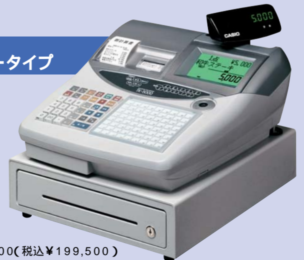
小型ドローアタイプ

TK-5000-S メーカー希望 小売価格 ¥190,000(税込 ¥199,500)