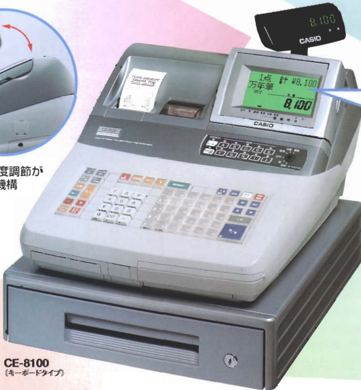
CE-8100 (キーボードタイプ)