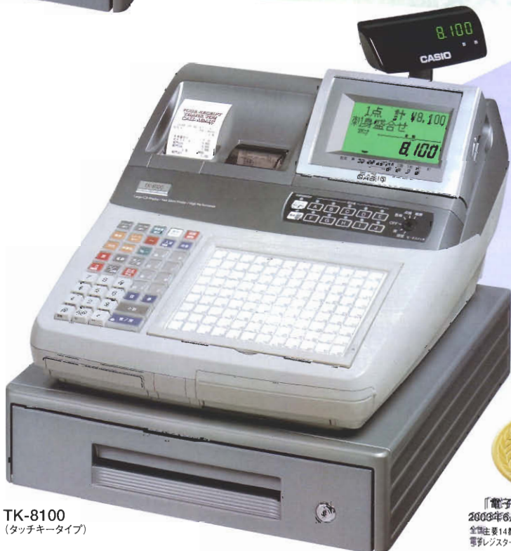
TK-8100 (タッチキータイプ)