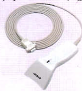
ハンドスキヤナー

オプションのスキヤナーによって、スキヤニング登録が可能になります。バーコードをスキヤナーが読み上げるので、正確でしかもスピーディー。登録ミスが軽減し、お客様の信頼度もアップします。